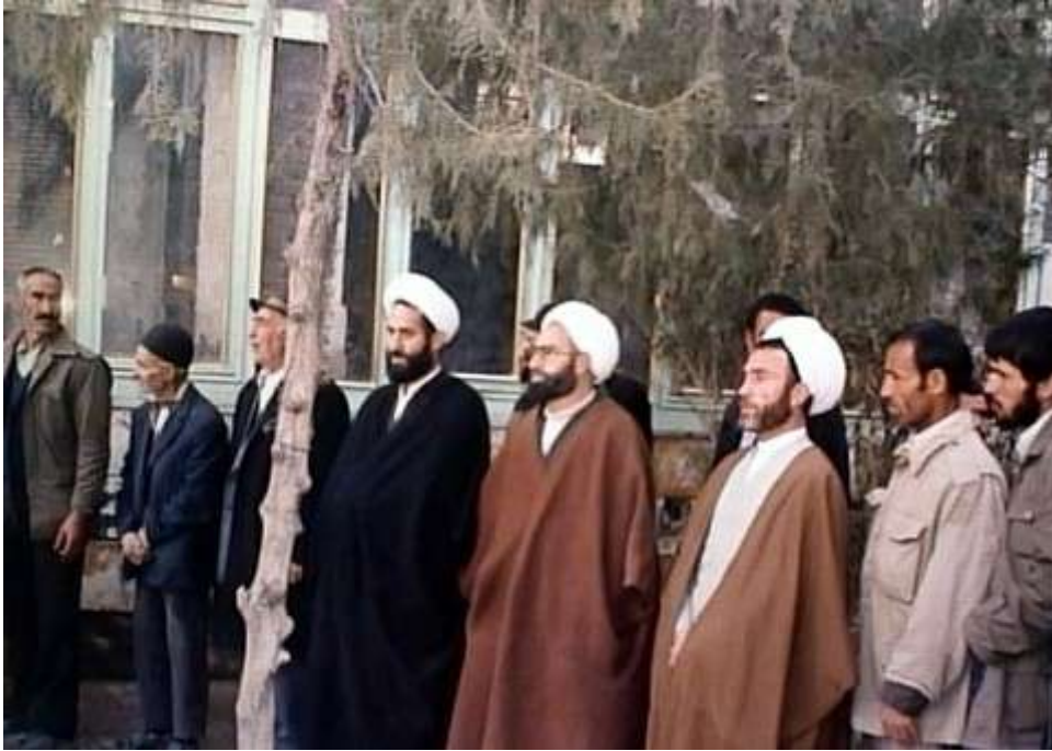
در صاف انتخابات برای رای گیری مجلس شورای اسلامی در نهاوند- سال 1359

سرانجام شهید محمد علی حیدری پس از عمری مجاهده در شامگاه 7 تیر ماه سال یکهزار و سیصد و شصت شمسی به * همراه سیدالشهدا انقلاب شهید مظلوم آیت الله دکتر بهشتی و هفتاد و دو یار صدیق امام در انفجار ساختمان مرکزی حزب جمهوری اسلامی توسط منافقین کوردل به شهادت رسید.