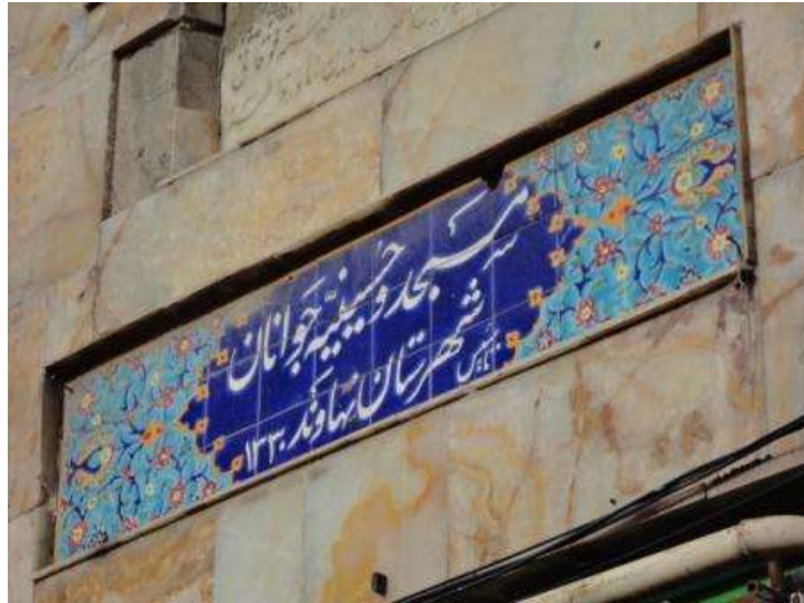
سر در ورودی حسینیه جوانان ، پایگاه اصلی مبارزاتی شهید حیدری و منطقه در نهاوند

1- انتخاب و گسترش حسینیه جوانان بعنوان پایگاه مبارزاتی خود با رژیم شاه.