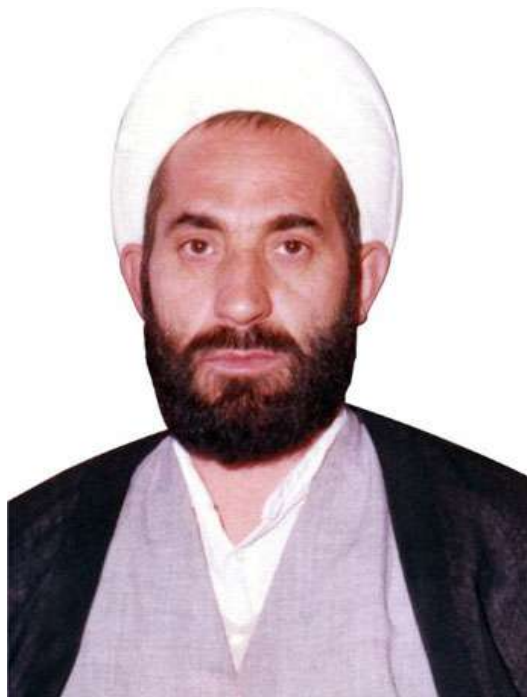
شهید آیت الله حیدری