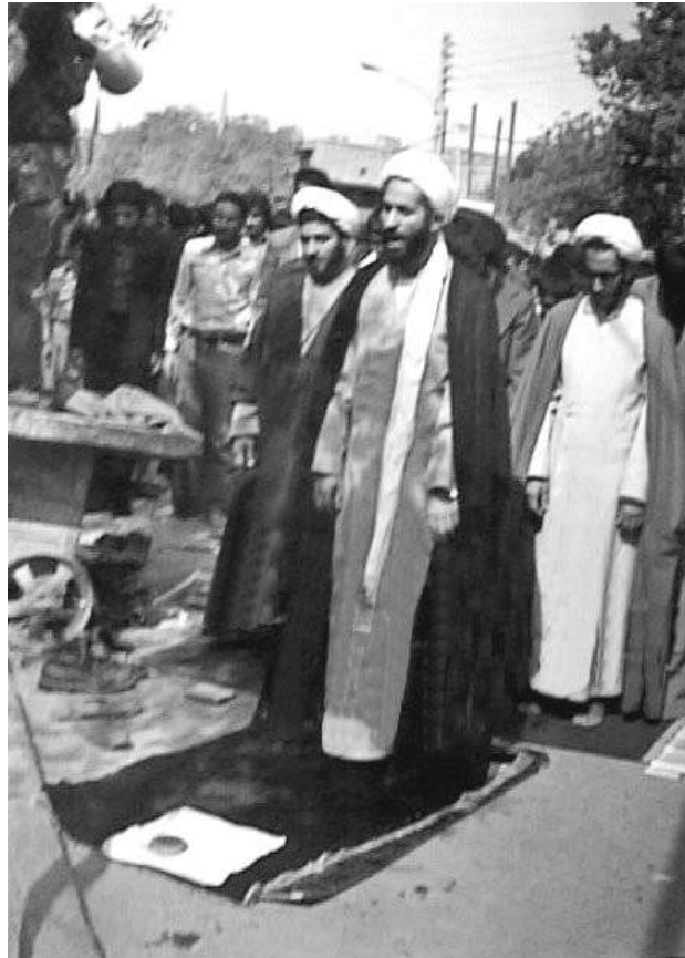
نماز جماعت شهید در خیابان پس از پلمپ و بسته شدن درب حسینیہ جوانان مقابل آن مکان

پس از اینکه مامورین از مبارزات و افشاگریها و سخنرانیهای شهید حسینیہ جوانان ناتوان شد درب حسینیہ را پلمپ و مامورین را به محاصره آنجا گماشت که از ورود و ادامه فعالیت ایشان جلوگیری کند. شهید حیدری پس از اطلاع از این موضوع در ظهر همانروز در مقابل درب بسته حسینیہ و در خیابان به نماز ایستاد و خیابان بسته شد و از این طریق با استقامت به مبارزه خود ادامه داد و سازمان اطلاعات و امنیت که اوضاع را اینگونه متشنج دید پس از چند روز تسلیم شد و مبادرت به باز نمودن قفل و درب حسینیہ شد.