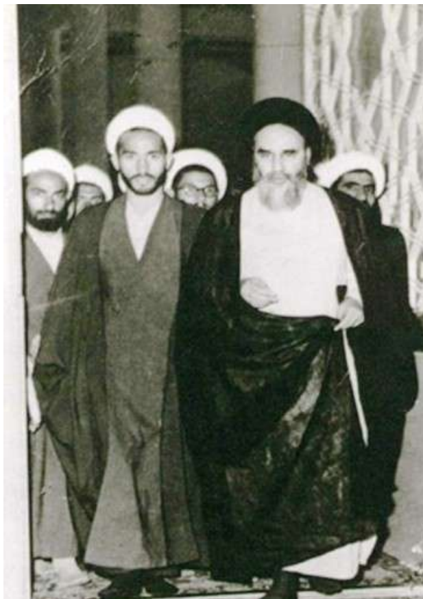
شهید حیدری در کنار حضرت امام خمینی (بعد از جلسه درس در مسجد اعظم قم) - سال 1341

شهید حیدری تابستانها در شهر نهاوند دروس حوزوی را برای طلاب تدریس می‌کرد و مسائل اسلامی را در بین جوانان اشاعه * می‌داد.