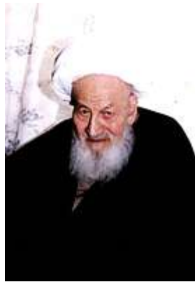
مرحوم حضرت آیت الله اراکی

درس خارج را از محضر آیت الله حاج شیخ محمد علی اراکی و آیت الله حاج سید محمد محقق داماد بهره می برد. همزمان دیپلم کامل متوسطه خود را بصورت متفرقه و آزاد با نمرات عالی اخذ نمود. همچنین جهت آموختن زبان انگلیسی در کلاسهای درس انگلیسی که شهید دکتر بهشتی برپا نموده بود بمنظور آشنایی علمای مبارز با علم روز شرکت نموده و زبان انگلیسی را نزد ایشان فرا گرفت و تسلط کامل داشت.