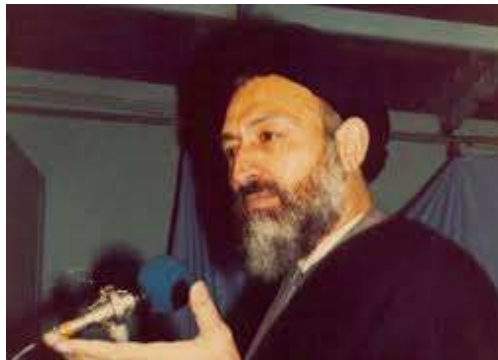
شهید مظلوم دکتر بهشتی