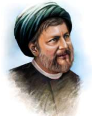
امام موسی صدر

فرزند شهید خاطره خود را چنین بازگو میکند : پس از این که پدر از سفر آمد شب بود ، يك ساك مشكي رنگ همراهش بود ، ما چشم براهش بودیم و نگران و منظر سوغاتي . هنوز درب ساك را باز نکرده بود تا سوغاتیهایمان را که شامل يك جعبه دوربین چشمي عكسهائي از مکه و مدینه ، قرآن چاپ بیروت ، مقداري لباس ( و يك راديو با موج کوتاه و گیرندگي قوي که براي خودش ، خلاصه . . سوغاتیهایمان را در بغل گرفته بودیم . بسوي بابا دویدیم تا او را (آورده بود تا راديو عراق ، و بي بي سي را گوش کند بیوسیم ، که . . ناگهان زنگ در صدا درآمد . مأمورین تا دندان مسلح به منزل ریختند و در میان گریه و زاري و فریادمان او را با خود بردند !